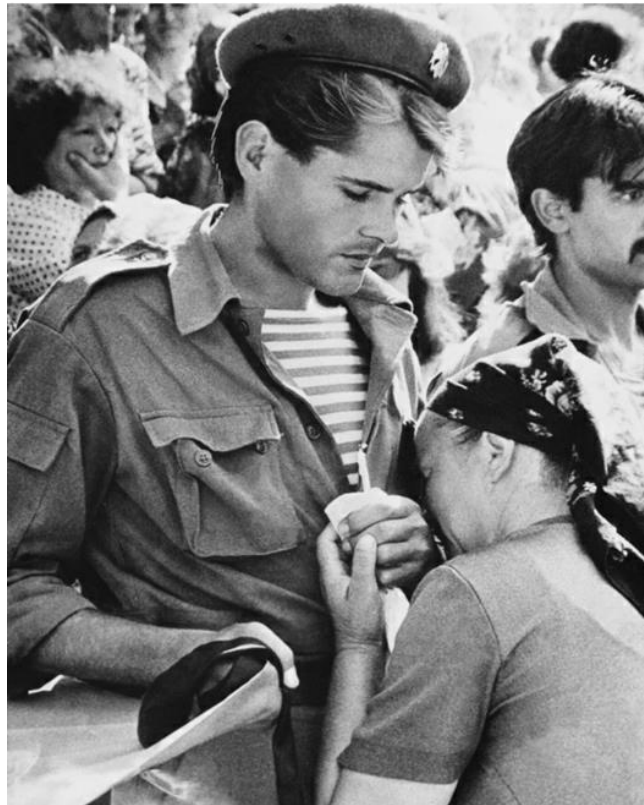
Iartă-ne, mamă, că nu l-am putut apăra... La funeraliile din iunie 1992, Chișinău.