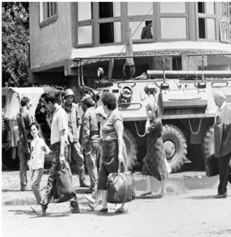
Pe drumul pribegiei...