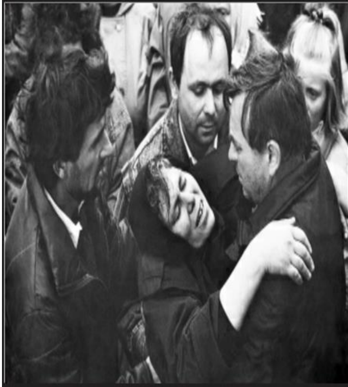
Mai bine mor și eu...