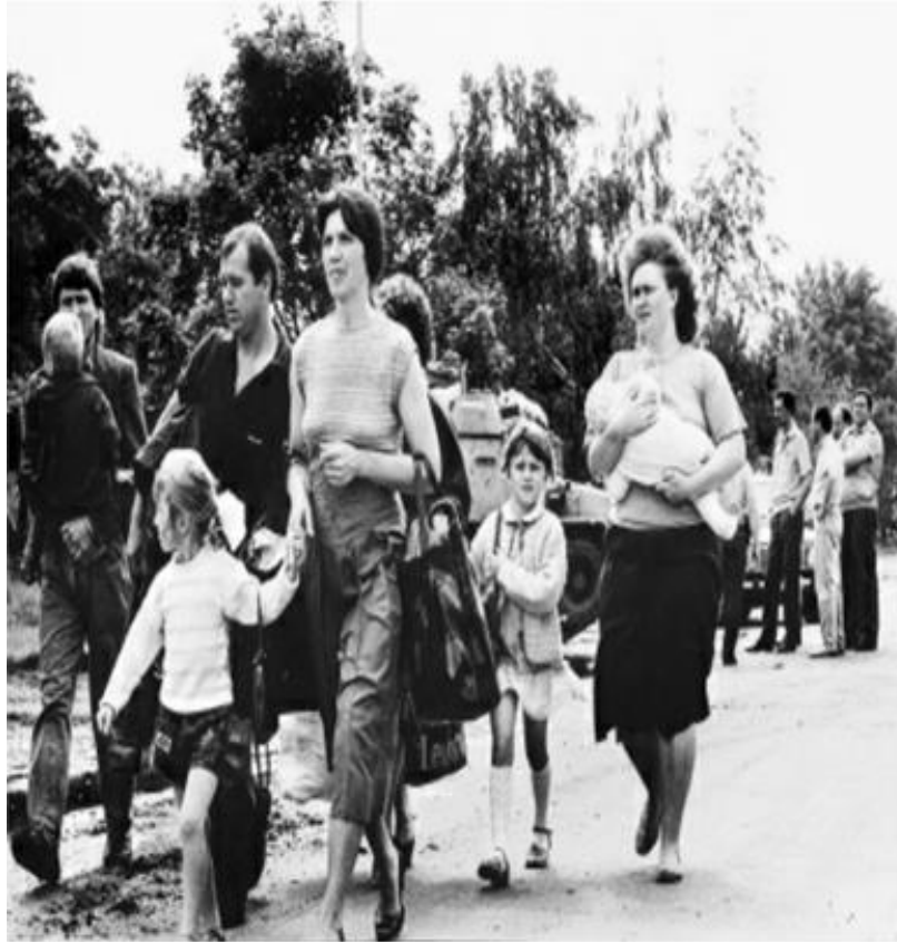
Valul înstrăinării. Refugiații din Tighina.