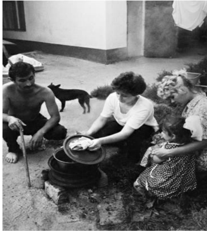
Îngrijorați de vremurile grele...