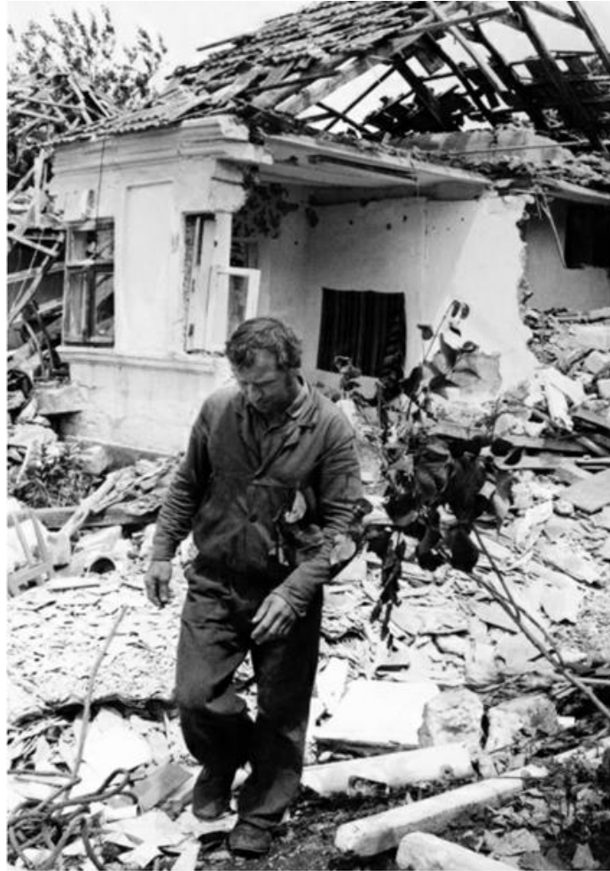
Urmele războiului pe străzile Tighinei, iunie 1992.