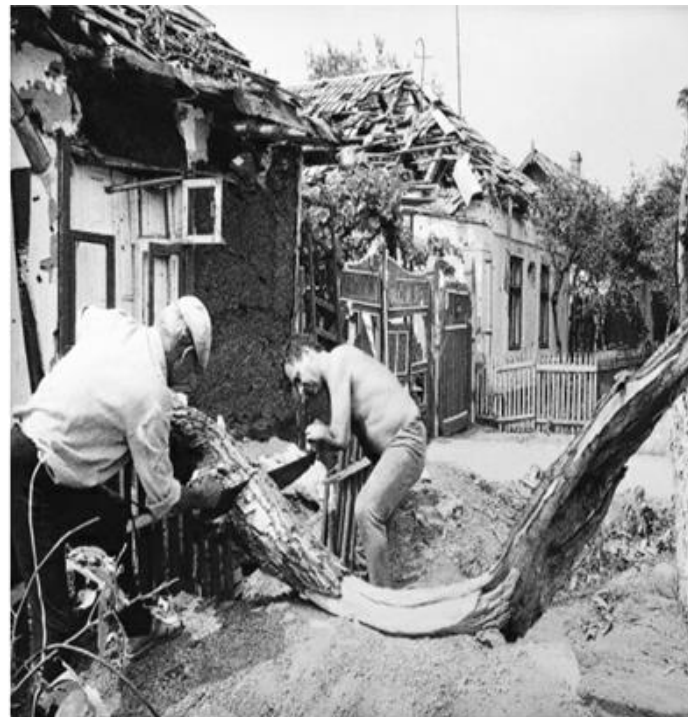
Tot mai dureros „De ce?”.