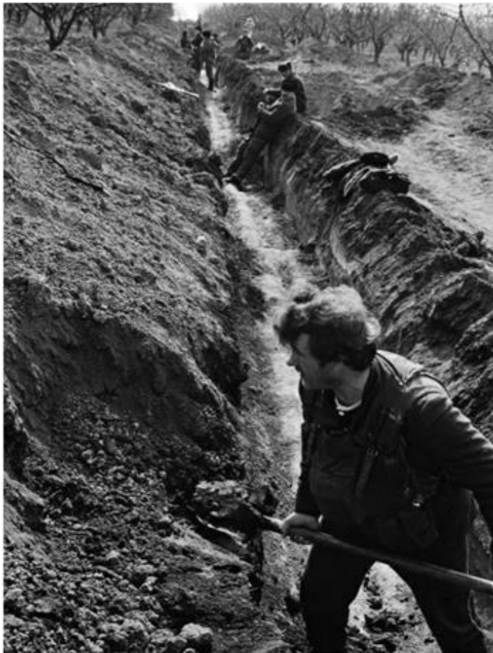
Prin grădini în paragină... la săpatul tranșelor. Voluntari pe platoul Doroțcaia.