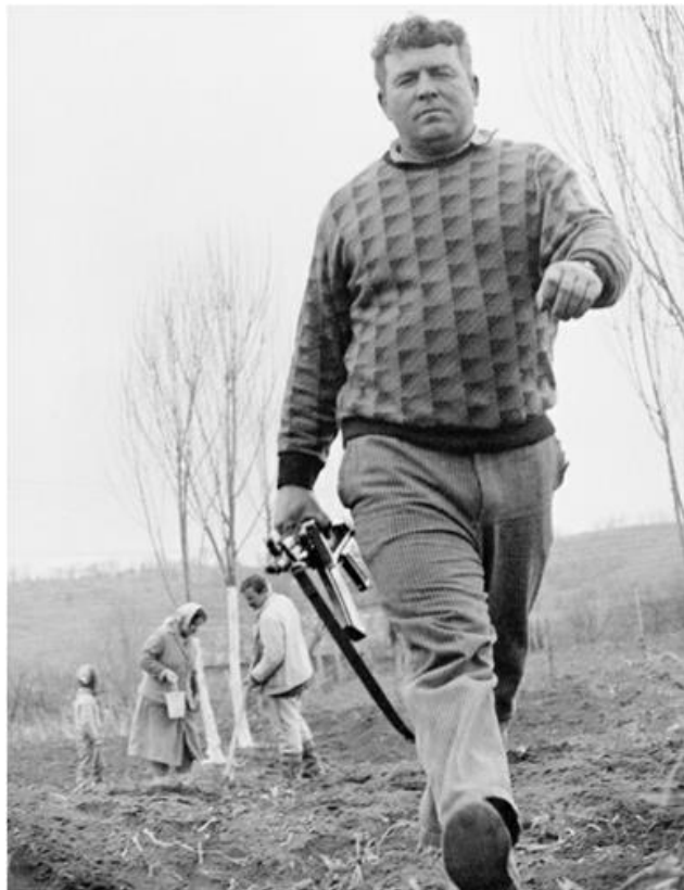
Activități pașnice în timp de război...