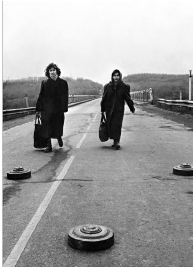
Trecând podul durerii...