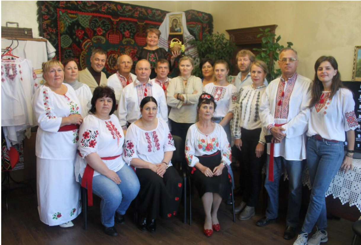
41. Împreună cu Asociația moldovenilor din regiunea Tiumeni

astfel de asociații există la Surgut și Nijne Vartovsk. Aceste asociații participă activ la Festivalul Naționalităților, care se desfășoară anual în Tiumeni sau alte orașe ale regiunii.