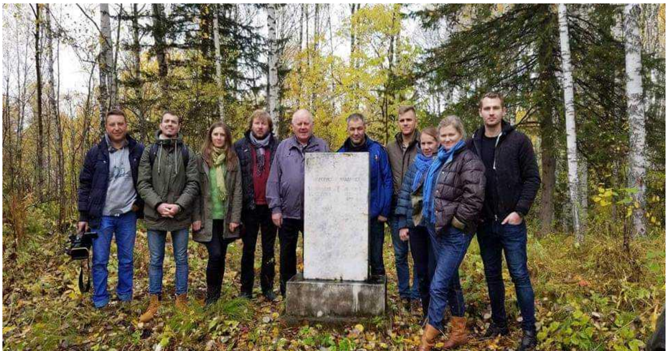
26. Cimitirul din satul Andreevka