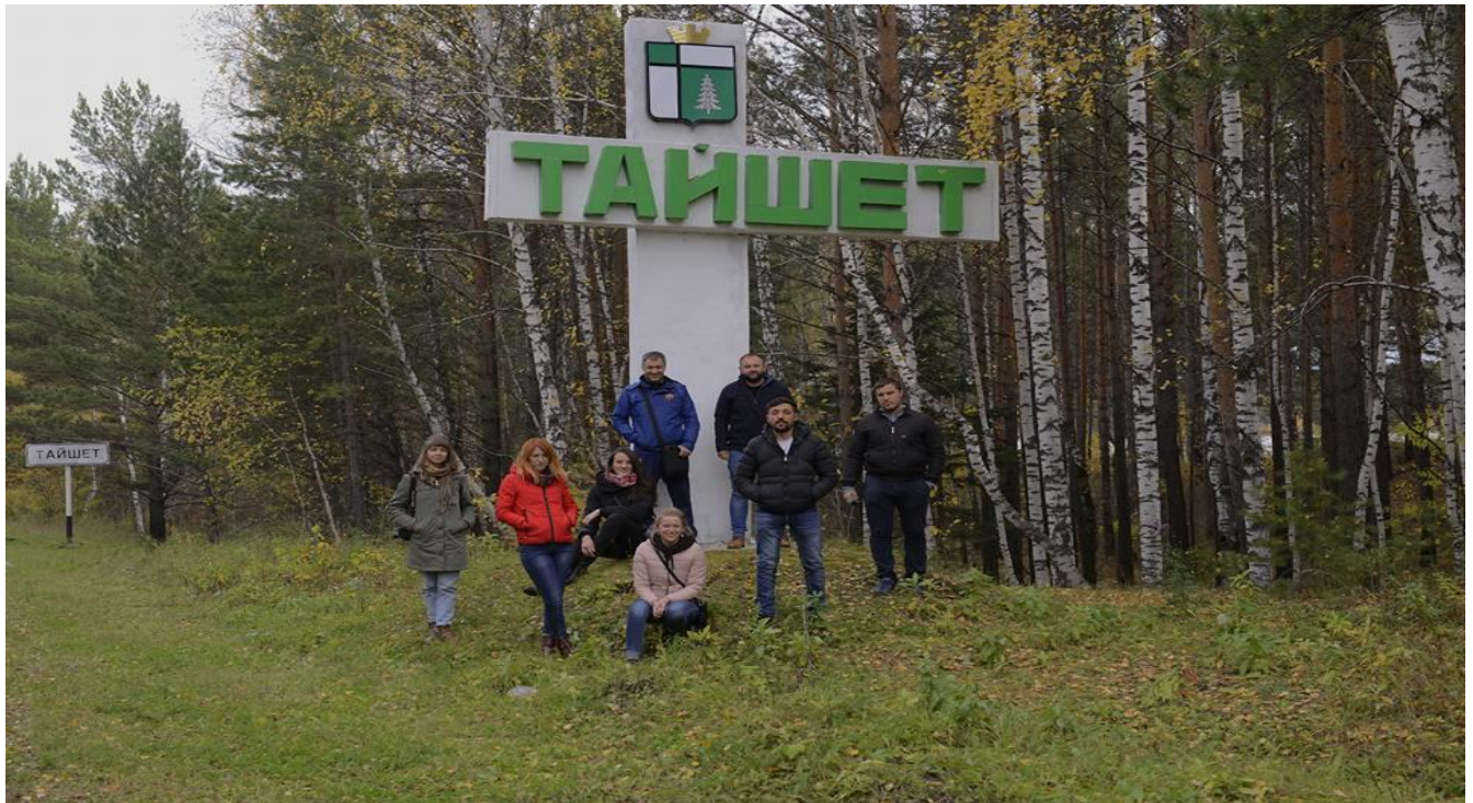
21. Taișet: La limita între Krasnoiasrl și Irkutsk