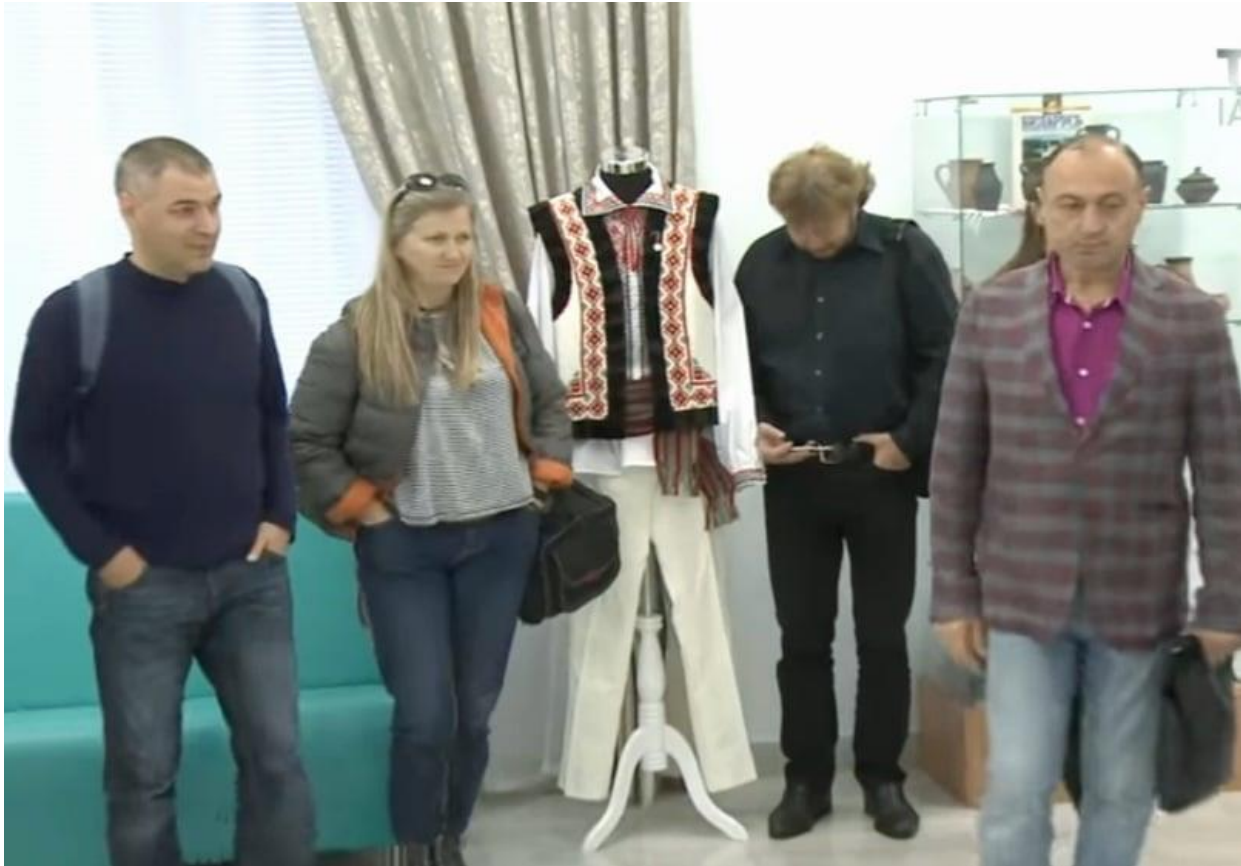
29. În vizită la Asociația „Luceafărul” din Novosibirsk

Datorită acestuia la Novosibirsk s-a instituit ziua națională a „Mărțișorului” și un festival care se petrece anual la Novosibirsk de 1 martie.